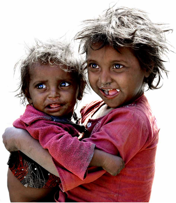
© Soňa Chlumecká Ausgezeichnet von der IAAP